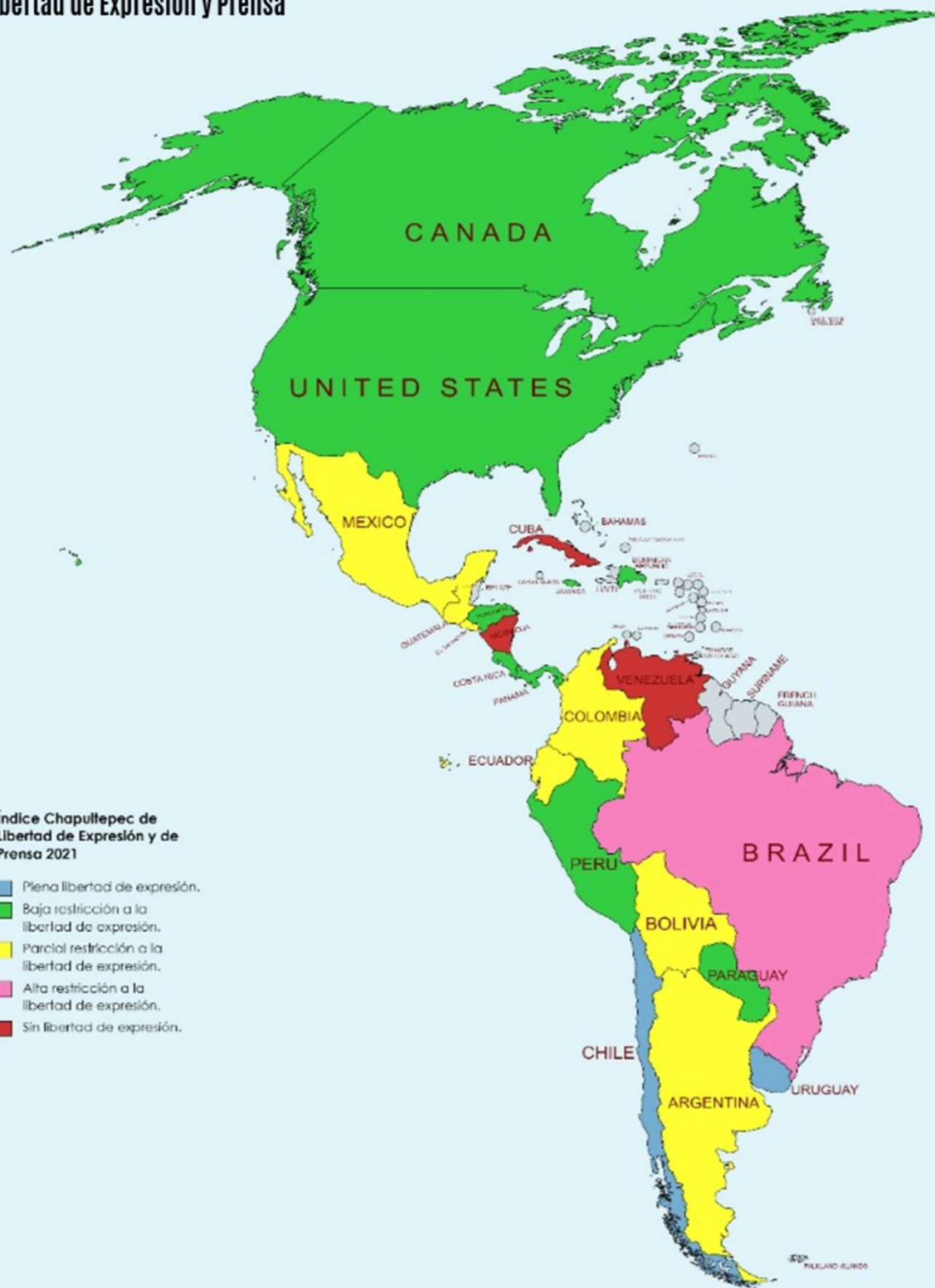
Índice Chapultepec de Libertad de Expresión y de Prensa 2021